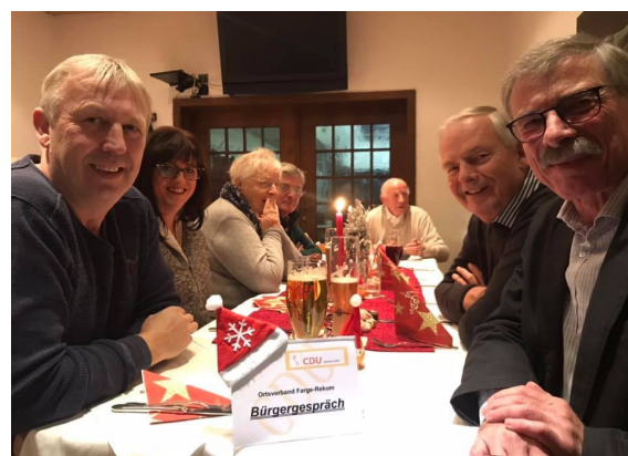
Weihnachtliches Bürgergespräch in Farge-Rekum