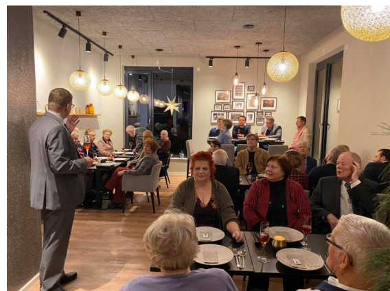
Weihnachtsfeier Burglesum im TORHAUS

Auch die Junge Union und die Senioren Union luden zu Veranstaltungen ein, in denen natürlich die vielen Ideen und Planungen für das Jahr 2020 besprochen wurden.