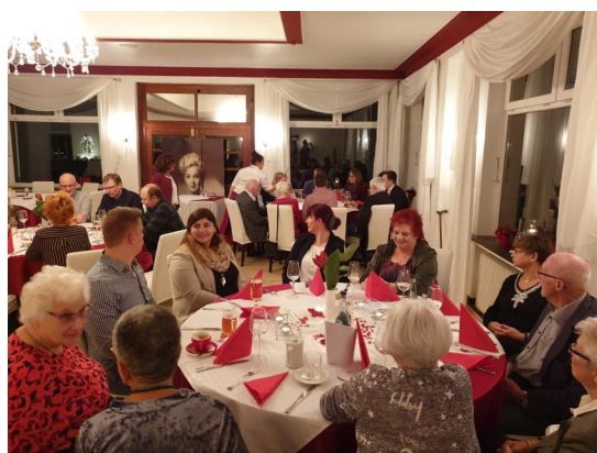
Traditionelles Labskausessen in Vegesack